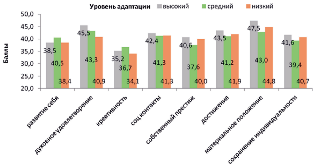
Рис. 1. Ценности спасателей с разным уровнем ПСПА

Так, в группе спасателей с высоким уровнем ПСПА наиболее значимыми ценностями оказались материальное положение ( x_{cp}=47,5 ), духовное удовлетворение от выполнения работы ( x_{cp}=45,5 ), достижения ( x_{cp}=43,5 ) и социальные контакты ( x_{cp}=42,4 ). Сохранение собственной индивидуальности, престиж и развитие себя имеют меньшую значимость и соответствуют средним нормативным показателям ( x_{cp}=41,64 ; x_{cp}=40,64 и x_{cp}=38,45 ). Наименьшую ценность представляет креативность ( x_{cp}=35,18 ). В целом, эгоистически-престижные