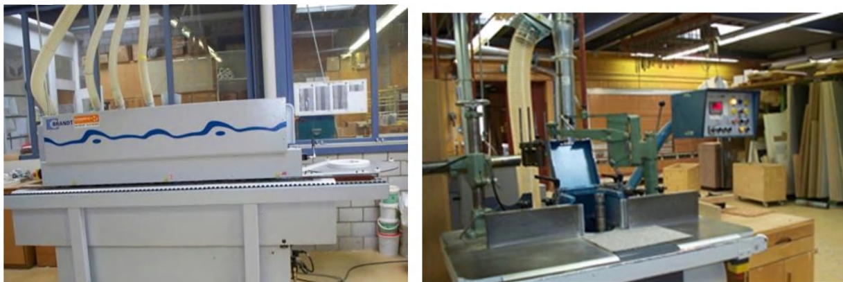
Рис. 5. Оборудование производственных мастерских

Зарплата социальных педагогов и мастеров выше, чем в гражданских учреждениях. Отбор персонала осуществляется на конкурсной основе.