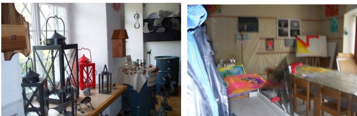
Рис. 4. Творческие мастерские

Молодежный Центр воспитательных мер в Калхрайне специализируется на сельскохозяйственных работах: животноводство, земледелие, садоводство, виноградарство, флористика, металлообработка, деревообработка, участок автосервиса. Особое внимание уделяется развитию творческих способностей