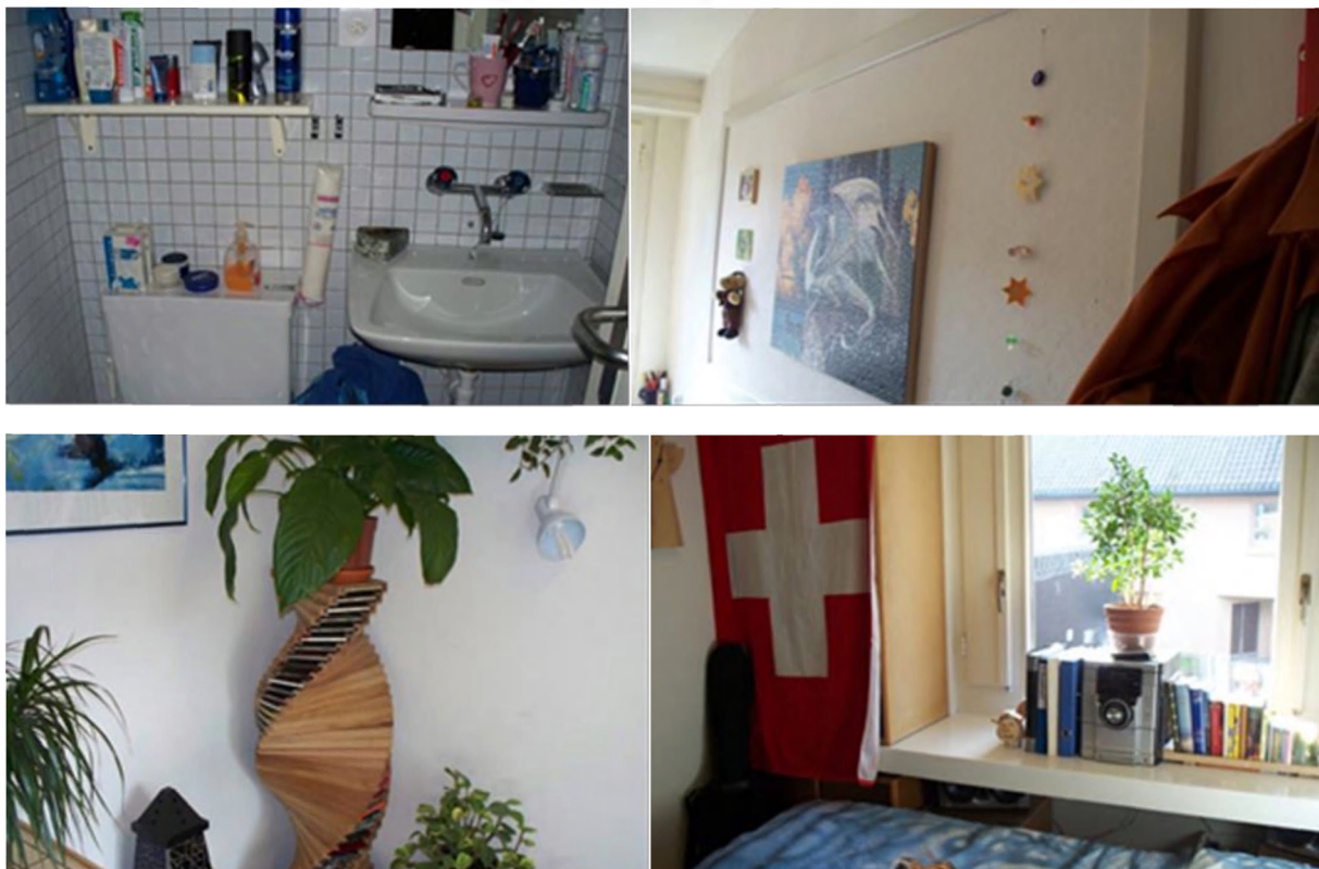
Рис.1. Комната осужденного

В закрытом отделении осужденные проживают по 1 человеку в комнате.