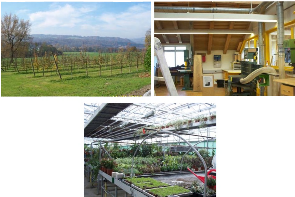
Рис. 3. Производственные мастерские

Молодежный Центр воспитательных мер в Калхрайне специализируется на сельскохозяйственных работах: животноводство, земледелие, садоводство, виноградарство, флористика, металлообработка, деревообработка, участок автосервиса. Особое внимание уделяется развитию творческих способностей