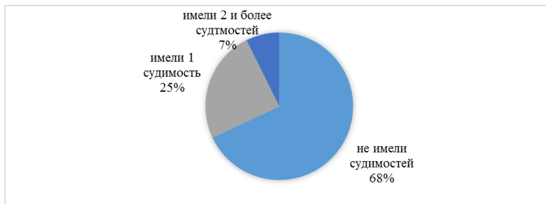
Рис. 2. Данные о количестве судимостей у лиц, отбывающих наказание за преступления экстремистско-террористической направленности

Две третьих – 68% (476 человек) из числа осужденных исследуемой категории ранее не имели судимостей, т.е. осуждены за преступления экстремистско-террористической направленности впервые. Ранее, до последнего осуждения: одну судимость имел каждый пятый – 24,7% (173 человека), две и более судимостей – 7,3% (51 человек).