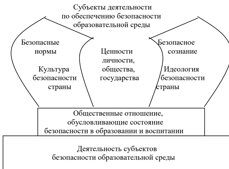
Рис. 2. Элементы системы безопасности образовательной среды

Схематично это можно изобразить следующим образом: