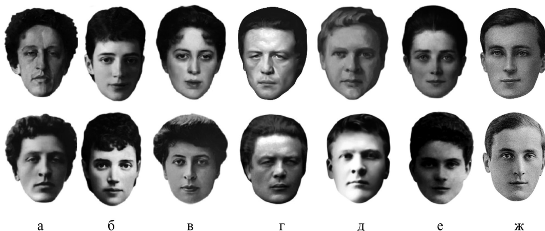
Рис. 1. Стимульный материал. Художественные портреты (верхний ряд) и фотоизображения (нижний ряд): а — А. Блок; б — Имп. Мария Федоровна; в — М. Морозова; г — А. Рубинштейн; д — Ф. Шаляпин; е — З. Юсупова; ж — Ф. Юсупов

В качестве стимульного материала использовались 14 изображений: 7 фотографий (черно-белые изображения) и 7 художественных портретов (цветные изображения) одних и тех же персонажей в спокойном состоянии — известных личностей России рубежа XIX — XX вв. (4 мужских и 3 женских), выполненных примерно в одном и том же возрасте. Это: певец Фёдор Шаляпин, композитор и пианист Антон Рубинштейн, князь Феликс Юсупов, поэт Александр Блок, Императрица Мария Фёдоровна, княгиня Зинаида Юсупова, меценат Маргарита Морозова. С помощью программы Adobe Photoshop CS4 изображения были подвергнуты специальной обработке: удалены все детали интерьера, фон, оставлены только изображения лица анфас без украшений и излишних деталей причёски, отцентрированные по линии глаз (рис. 1).