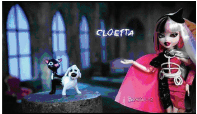
Рис. 2. Кукла из серии Bratzillas