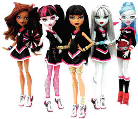
Рис. 1. Куклы из серии Monster High