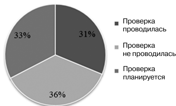
Рис. 1. Соответствие квалификационных характеристик требованиям профессионального стандарта

Специальной задачей информационно-аналитического сопровождения процесса применения профессионального стандарта «Педагог-психолог (психолог в сфере образования)» стало изучение региональных практик применения профессионального стандарта при формировании кадровой политики и в управлении персоналом. С этой целью в 2017 г. при поддержке Минобрнауки России был проведен мониторинг регионального опыта внедрения профессионального стандарта «Педагог-психолог (психолог в сфере образования)», который позволил выявить