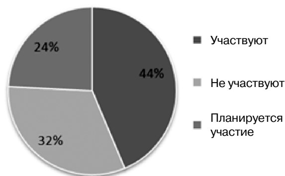
Рис. 3. Участие организаций в реализации межведомственных моделей оказания социальных и образовательных услуг

Таким образом, результаты мониторинга свидетельствуют о том, что большинство образовательных организаций в регионах Российской Федерации ведут целенаправленную работу по организации применения профессионального стандарта «Педагог-психолог (психолог в сфере образования)» в соответствии с Постановлением Правительства Российской Федерации от 27 июня 2016 г. №584.