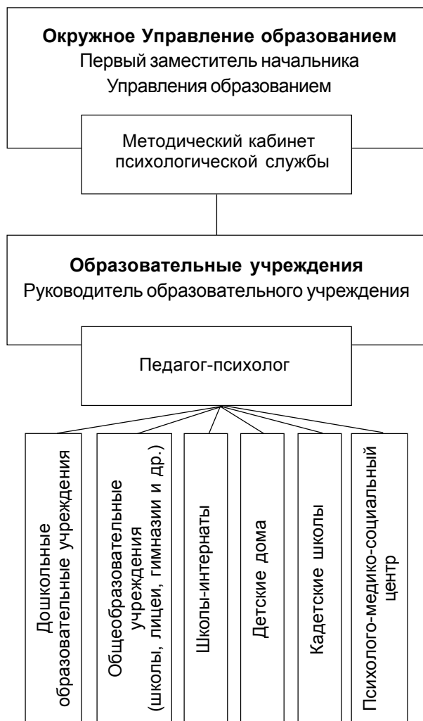
Рис. 4. Схема организации среднего звена управленческой структуры психологической службы образования г. Москвы

В обязанности отдела психологической службы Окружного комитета образования входят административное управление и научно-методическое обеспечение вышеупомянутых первичных звеньев психологической службы. Сотрудники отдела сосредотачивают свою деятельность на следующем (рис. 5):