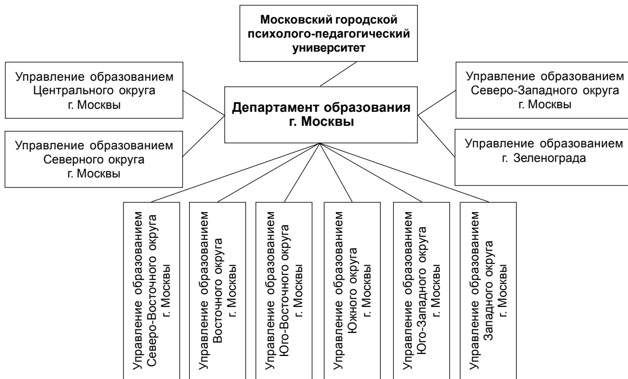
Рис. 1. Общая схема управления образованием г. Москвы

вой и организационно-методической основой ее формирования и организации ее деятельности.