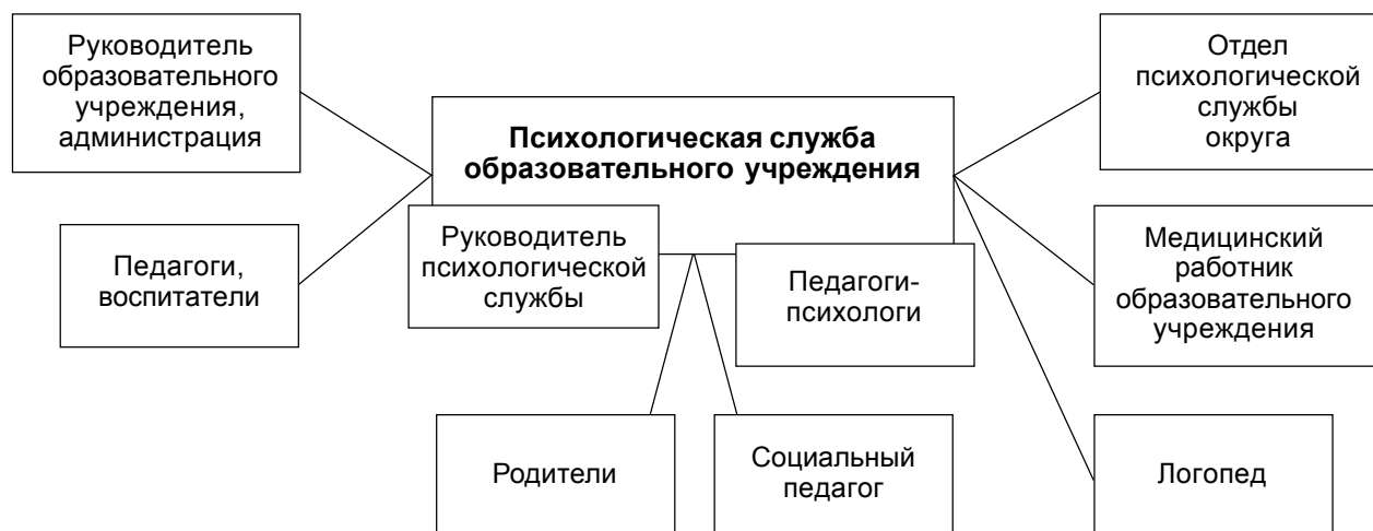
Рис. 6. Схема первичного звена управленческой структуры психологической службы

ния к ребенку на разных возрастных этапах работы с детьми, когда происходит «стыковка» представлений, понимания, умений взрослых, работающих с детьми одного возраста, и взрослых, работающих с детьми другого возраста. Приведем пример.